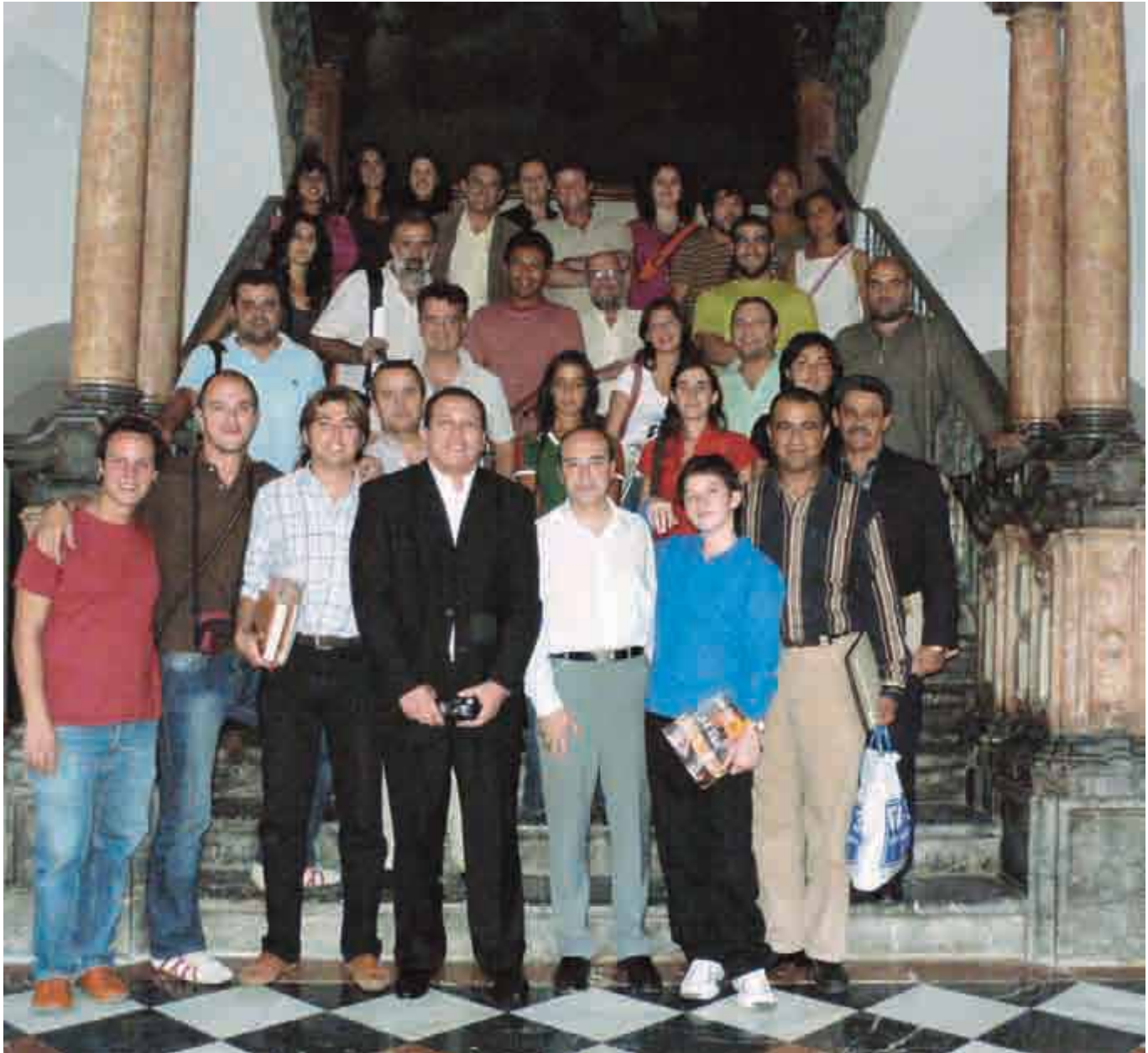
Tras la clausura de las Jornadas de Cooperantes en octubre de 2006