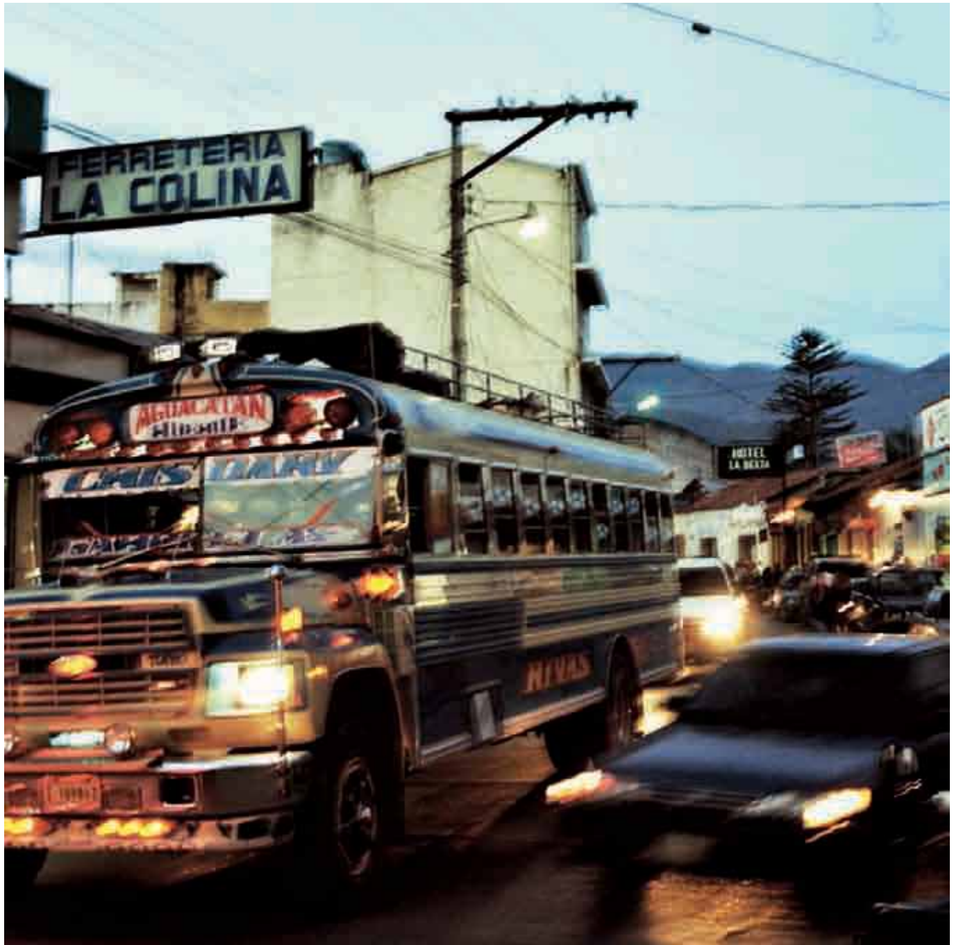
Guagua de Guatemala.