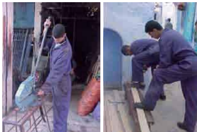
Escuela Taller de Marruecos

(O.C.I.), Escuela Taller de Patrimonio, FAMSI, Mancomunidad de Municipios Guadajoz y Campiña Este.