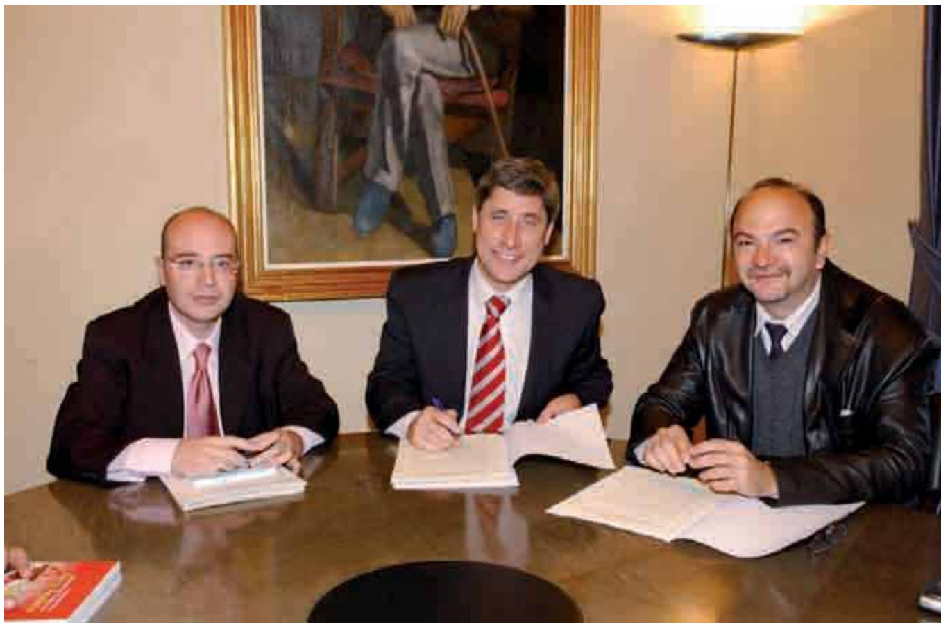
Durante la firma del Convenio de Diputación con FAMSÍ