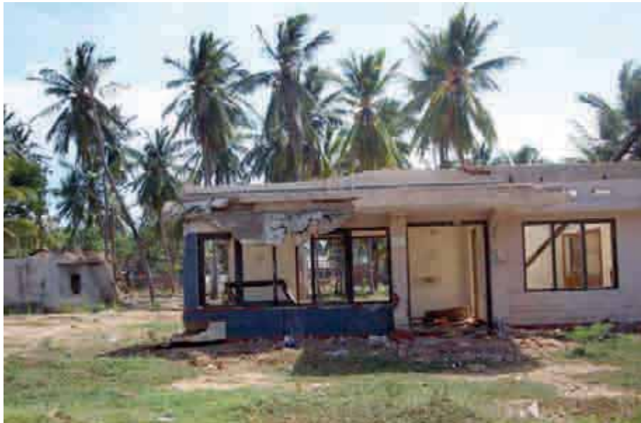
Una vivienda arrasada por el tsunami

El proyecto pretende la reconstrucción y equipamiento de cinco de los Centros de Desarrollo Comunitarios destruidos por el tsunami de 26 de diciembre de 2004 en el distrito de Galle, en la costa sur de Sri Lanka. Estos Centros de Desarrollo Comunitario están diseñados como el escalafón más bajo de la administración pública de Sri Lanka y por lo tanto son el motor principal en las identificaciones de prioridades desde el punto de vista de la población local. En estos centros la población no sólo se reúne de forma representativa con autoridades locales, nacionales y extranjeras sino que están dotados de servicios a la comunidad, como servicios de información materno infantil, guardería, talleres, etc.