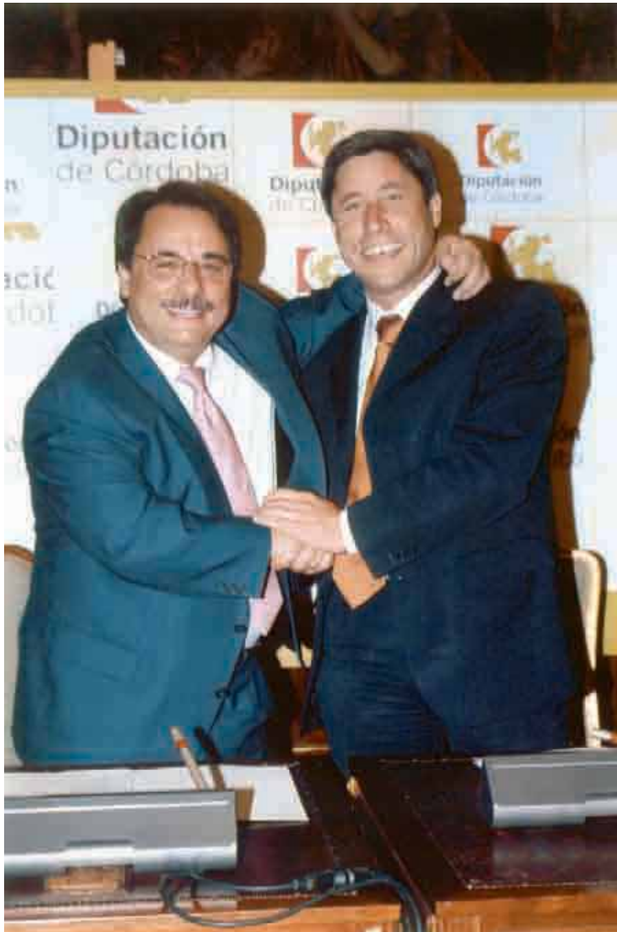
Firma del Convenio de Diputación - CEHAP