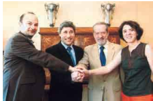
Acuerdo de colaboración entre FAMSI y la Diputación de Córdoba y Sevilla

El trabajo de la oficina de cooperación internacional con el FAMSI se ha llevado a cabo a través de diferentes convenios dentro de los cuales se han ejecutado proyectos de diferente índole que comentamos.