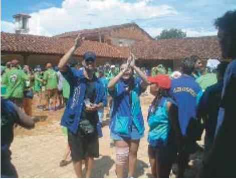
Fiesta de carnaval

2ª o 3ª semana de Febrero: Fiestas de Carnaval