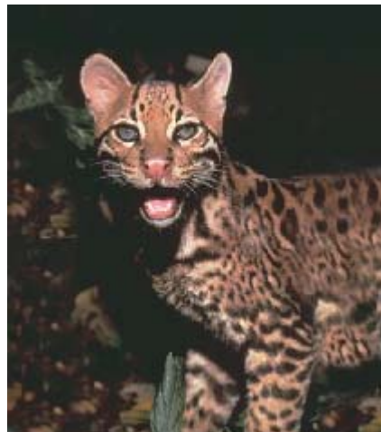
Gato del monte

Se pueden encontrar cerca de 139 clases de mamíferos como tigres o jaguares leones o pumas antas, o tapires, monos, y el ciervo de los pantanos. Dan protección a 33 especies en peligro de extinción.