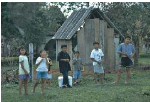
Niños de la región

Existen poblaciones que no superan los 1500 habitantes que intentan prosperar tras la caída de la industria del caucho, con los recursos de la zona. La mayoría pertenecen al linaje Chiquitano.