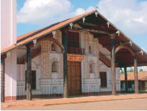
Templo actual de San Ignacio

El actual templo de San Ignacio, no es ninguno de los anteriores pues el pueblo misional sufrió un traslado ya en los comienzos de su historia con población de Zamucos, Satiénos, Ugaronos, y Tapios.