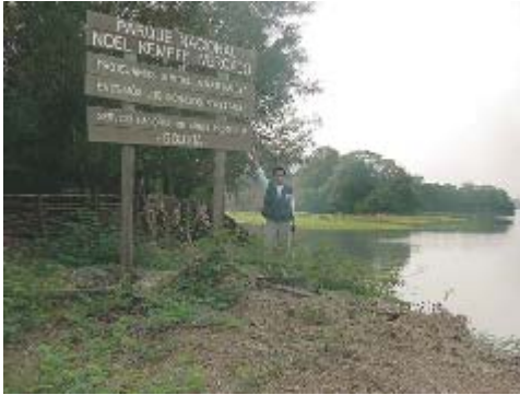
Parque Nacional Noel Kempff Mercado

homenaje al profesor del mismo nombre, se amplían sus límites a 706.000 ha., y en 1996 se vuelve a ampliar a 1523.446 ha. Y declarado Patrimonio Natural de la Humanidad.