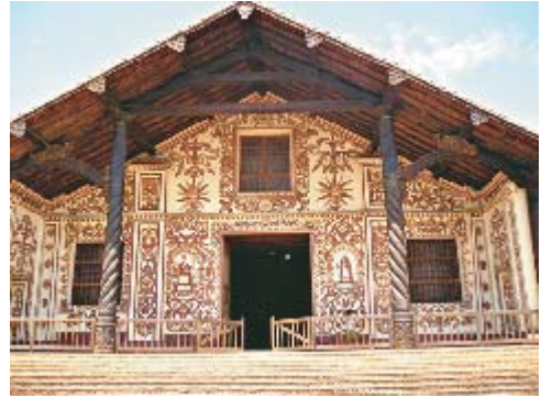
Iglesia de San Miguel

Los trabajadores agrícolas tenían a su cargo la producción de cereales para su alimentación, las mujeres, se ocuparon de los textiles, los artesanos y constructores se encargaban del material para la construcción de obras, tales como el majestuoso templo en honor al Arcángel San Miguel.