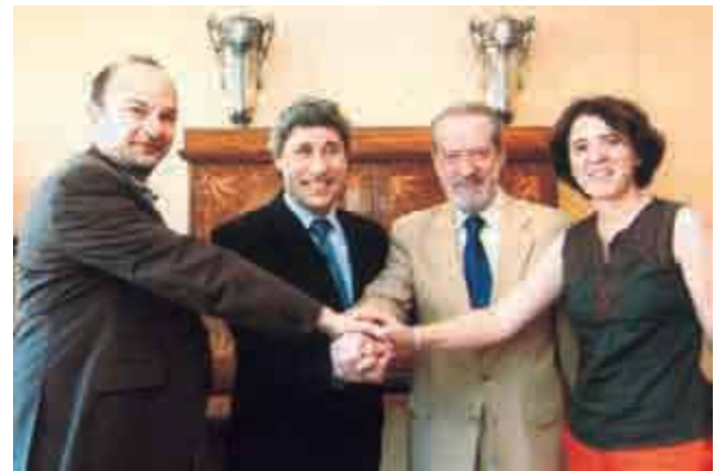
Acuerdo de colaboración entre FAMSI y la Diputación de Córdoba y Sevilla

El trabajo de la oficina de cooperación internacional con el FAMSI se ha llevado a cabo a través de diferentes convenios dentro de los cuales se han ejecutado proyectos de diferente índole que comentamos.